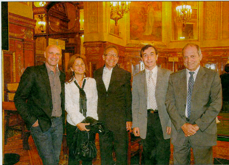
La présentation du Printemps des Arts.

L'événement sera le marathon Beethoven accompli par le pianiste François-Frédéric Guy qui, en dix concerts, jouera l'intégralité des trente-deux sonates de Beethoven! A noter la venue du Philharmonique de Radio-France pour un concert Messiaen sous la direction de Myung-Whun Chung