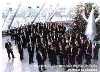
Orchestre Philharmonique de Monte-Carlo Portrait Schönberg