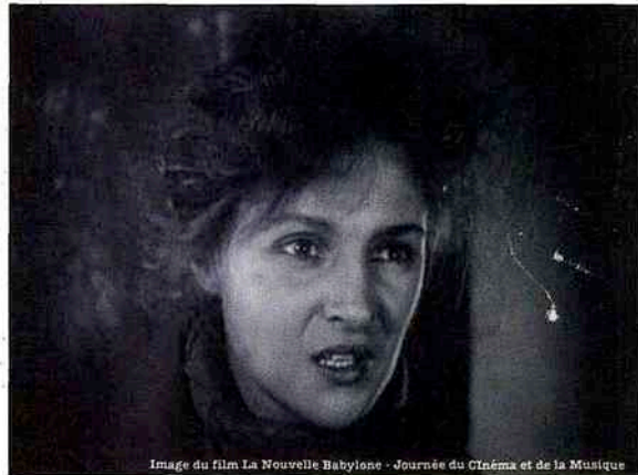
Image du film La Nouvelle Babylone - Journée du Cinéma et de la Musique

De Pastorale en Hammerklavier , cette ascension dans le massif des sonates est multiple et passionnante. La Tempête ou l' Appassionata